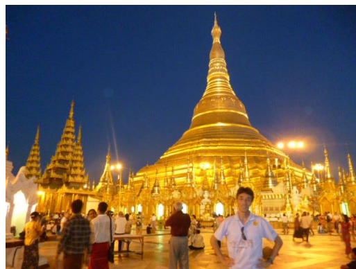
ミャンマー：夜のシュエダゴンパゴダ