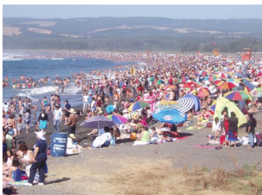
チリ：観光客でにぎわうピチレムの海水浴場